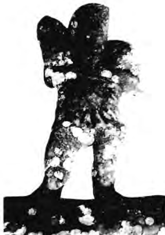
Fig. 2 - Fragment de sarcophage paléochrétien remployé dans la façade de l'église Saint-Just de Valcabrière en Saint-Bertrand-de-Comminges.