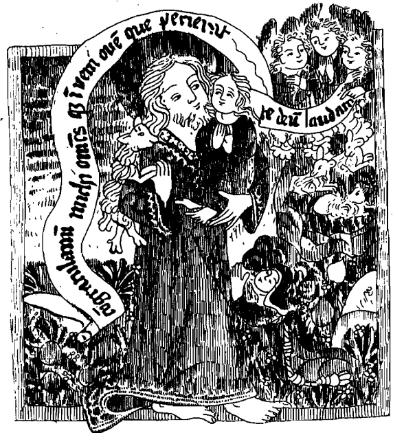
Fig. 3 - « Le Bon Pasteur » : miniature de Sibilla von Bondorf, datée de 1478 (Londres, British Museum, Add. MS 15, 686, fol. 30 v.).

ikonographie 44 (hors enluminures) renvoie à une référence puisée dans l'ouvrage de A. Legner sur Der Gute Hirte , et qui se rapporte en fait à un vitrail daté du XIV e siècle (à Mulhouse) 45 . Certes, au cours des XIII e -XV e siècles, des figurations du Bon Pasteur se rencontreront bien toujours sur les manuscrits (fig. 3), mais leur type est le plus souvent tout différent (mouton tenu d'une seule main et pendant sur le dos, ou encore posé sur l'avant-bras). L'image sculptée du Bon Pasteur portant sa bête sur les épaules ne réapparaîtra qu'à la Renaissance en France et au Portugal, cette fois sur des oeuvres laïques et non dans les églises, avant de se multiplier dans l'imagerie du XVII e siècle.