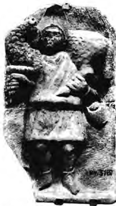
Fig. 1 - Stèle provenant des environs de Grombailia (Tunisie), et présentée au Musée du Bardo (N° d'inventaire : 3318) avec la légende suivante : « Dieu africain portant un bélier ».