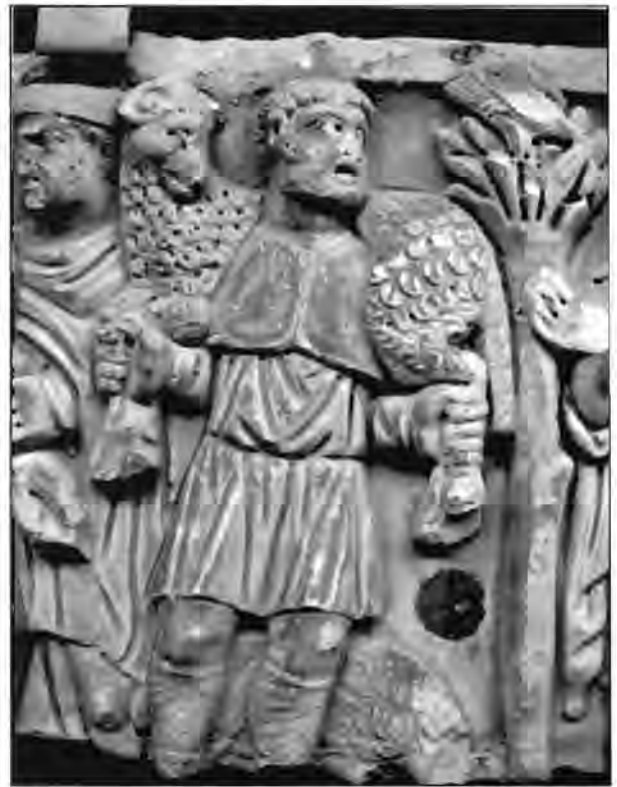
Fig. 7 - Fragment de sarcophage en marbre, de la première moitié du IV e siècle, qui était conservé au XVIII e siècle dans l'église de St-Honorat-des-Alyscamps, et se trouve maintenant au Musée archéologique de la ville d'Arles (n° d'inventaire : FAN.92.00.2521).

et remotivé en asne puis âne, donnant lieu à toutes sortes de confusions, et permettant la remotivation des anciens ane , anette , anille , en âne (-cheval-jument) ou en agneau (-mouton-brebis-chèvre). La dame-oiselle et sa robe de plumes ne furent alors plus comprises que comme « Peau d'Âne » ou jeune fille à l'âne, pendant que maintes oies surnaturelles étaient peu à peu remplacées par d'assez ordinaires moutons. Or cet oubli du sens premier du mot ane remonte au XII e siècle, celui où « la pression du folklore sur la culture savante est la plus vive, où l'église s'ouvre davantage à des traditions qu'elle avait dans le Haut Moyen Âge détruites, cachées ou ignorées » 143 : c'est justement là l'époque à laquelle Jacques de Voragine, rédigeant la première version de la vie de saint Christophe, a mentionné l'épisode de la traversée du gué et du portage d'un Christ-enfant de plus en plus pesant.