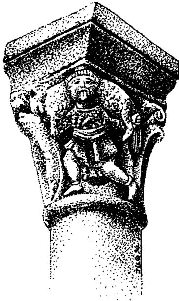
Fig. 5 - Chapiteau de l'église d'Isoire (Puy-de-Dôme) montrant un personnage tirant la langue, et ployant sous le poids d'un mouton gigantesque.

paraissant aucunement souffrir du poids de son vivant fardeau.