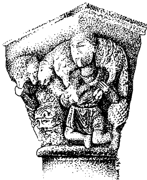
Fig. 4 - Chapiteau de l'église de Saint-Nectaire (Puy-de-Dôme), représentant deux personnages tirant la langue, aux genoux pliés jusqu'au sol sous le poids d'un mouton énorme, et entre lesquels se trouve une tête de diable.

Mais d'autres détails encore incitent à douter de la validité de cette identification. En effet, à Besse, le petit végétal qui pousse près des porteurs est un chêne, arbre dont l'abbé L. Perrier fait remarquer qu'il craint le froid « et