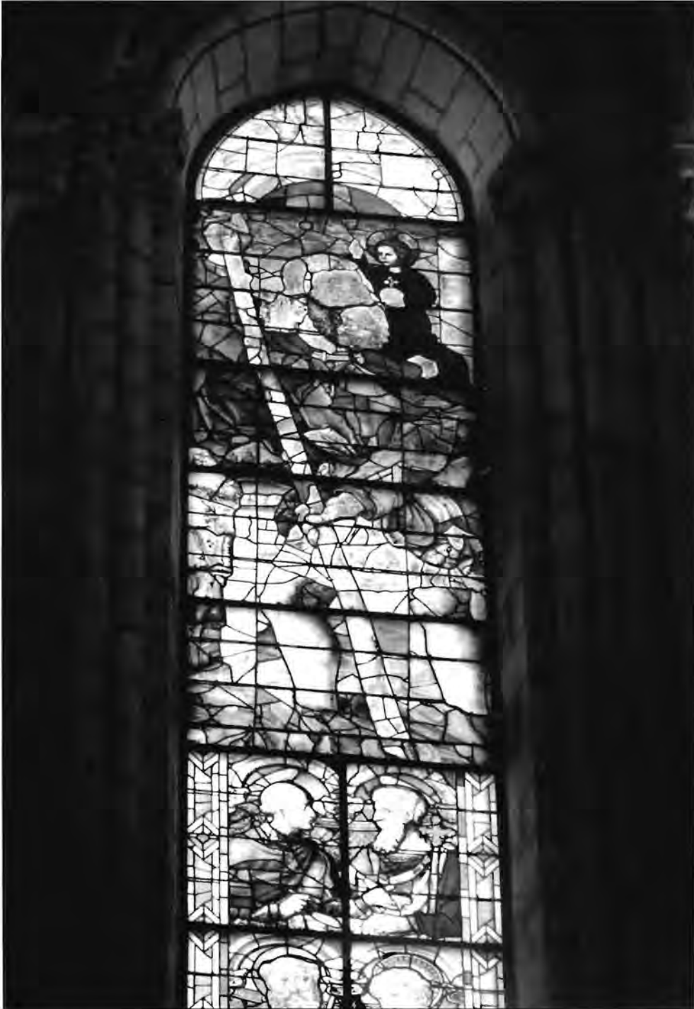
Vitrail de saint Christophe, cathédrale d'Angers.

Les photos et dessins sont de l'auteur, à l'exception de la photo ci-dessous.